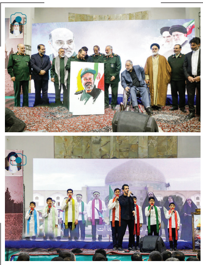
بزرگداشت سردار زاهدی در اصفهان

مراسم گرامیداشت سرلشکر شهید محمدرضا زاهدی، صبح دوشنبه با حضور سردار علی فدوی، جانشین فرمانده کل سپاه پاسداران و دیگر مسئولین لشکری و استانی در حسینیه گلستان شهدای اصفهان برگزار شد.