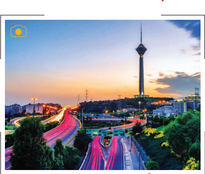
بازگشایی مجدد درهای برج میلاد

با تلاش شبانه‌روزی مجموعه فنن برج میلاد و شهرداری تهران و همچنین برق منطقه‌ای تهران، عملیات کابل‌کشی بزرگراه شهید همت پایان یافت و درهای برج میلاد مجدداً بر روی شهروندان بازگشایی شد.