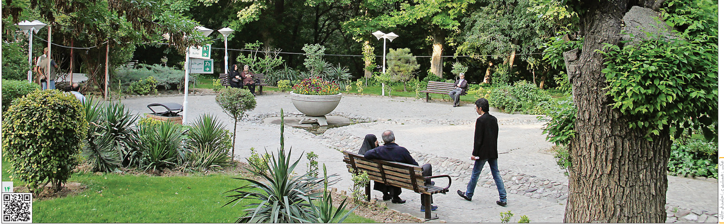
باسکن این کیوارکد گزارشی درباره احداث مسجد در پارک قیطره ببینید.

رئیس شورای شهر تهران: باید کمی فکر کنیم و تحت تأثیر جو روانی و تبلیغاتی قرار نگیریم چرا که تهران مسجد کم دارد و ما بر اساس قانون عمل می‌کنیم