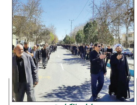
عزاداری ۲ کیلومتری اهالی خوی

۱۳ فروردین ۱۴۰۳ در حرکتی خودجوش مردم روزه‌دار خوی در سوگ مولود کعبه علی بن ابیطالب (ع) به عزاداری خیابانی پرداختند. طول جمعیت شرکت‌کننده در عزاداری برای امیرالمومنین در شهر دارالمومنین خوی به بیش از ۲ کیلومتر می‌رسید.