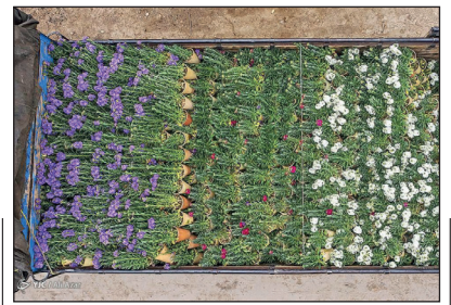
پرویش «شب‌بو» در آستانه بهار

گل شب‌بو از دیرباز زینت‌بخش سفره‌های هفت‌سین ایرانی‌ها بوده است. این گل، از اواسط اسفندماه می‌شکفت و تا اواسط اردیبهشت، زیبایی و عطر خود را حفظ می‌کند. اصفهان، سابقه ۴۰ ساله در تولید گل شب‌بو دارد و با تولید سالانه ۱۰ میلیون و ۳۰۰ هزار گلدان رتبه نخست کشوری را به‌خود اختصاص داده است. امسال نیز در آستانه فصل نو، باغداران گلخانه‌های خمینی‌شهر اصفهان طبق روال هر سال، گل‌های خوش‌عطر شب‌بو را تولید و روانه بازار نوروزی کشور می‌کنند.