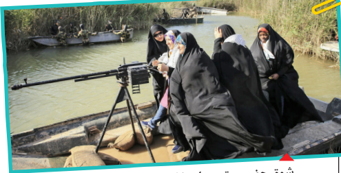
شوق حضور و تجربه‌ای خاص