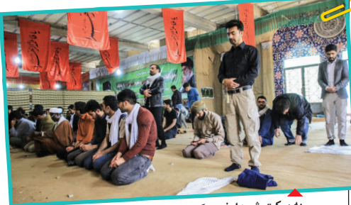
به برکت شهدا، فرهنگ دفاع مقدس در دنیا منتشر شده است.