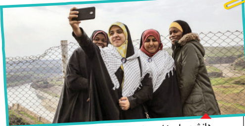
دانشجویان خارجی که در دانشگاه‌های ایران تحصیل کرده و داوطلبانه در این سفر شرکت می‌کنند.