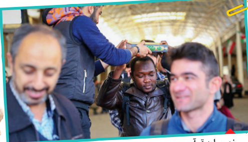
زیر سایه قرآن

چطور با خودروی شخصی عازم راهیان نور شویم؟