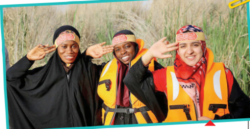
هرساله حجم بالایی از زائران غیر ایرانی به مناطق عملیاتی دوران دفاع مقدس می‌آیند.

دانشجویان خارجی در قالب کاروان راهیان نور در سفرهایی چندروزه به مناطق عملیاتی جنوب کشور، از یادمان‌های فتح‌المبین، یادگان دو کوه، طلائی، شلمچه، علقمه و موزه خرمشهر بازدید کردند. چند قاب از این حضور را می‌بینید.