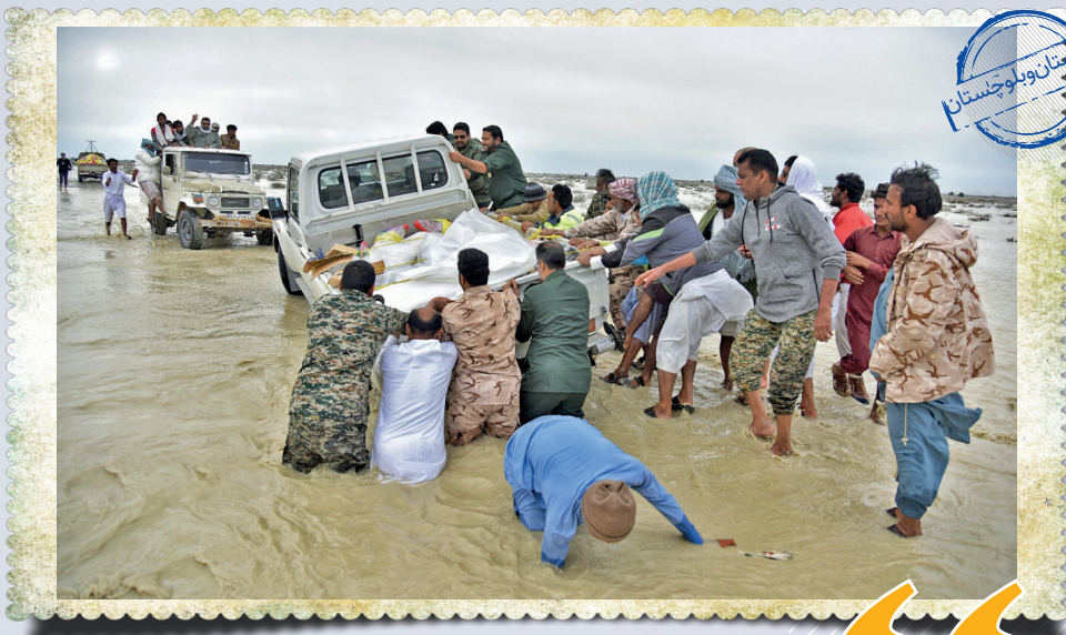
سیستان و بلوچستان

گزارش میدانی از روستاهای گرفتار در سیل در تلاقی ۲ رودخانه بزرگ استان سیستان و بلوچستان