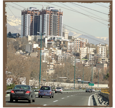
■ حدود قریه اوین ■ شمال پایتخت