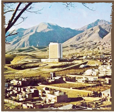
■ سابقه زیست در اوین ■ هزاره اول و دوم قبل از میلاد مسیح

معتقدند این نوع ظروف به هزاره اول و دوم قبل از میلاد مسیح تعلق دارند.»