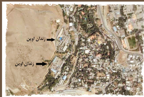
■ ماجرای ساخت زندان اوین ■ خیابان شهید کجویی

یکی از اماکن معروف در همسایگی محله اوین، زندان اوین است. جالب است که این زندان ۵۲ ساله و معروف ایران در پلاک ثبتی ۶۸ قریه اوین واقع نشده است. این زندان روی زمین‌های روستای کوچکی در همسایگی اوین ساخته شده است. سیدمهدی اعرابی با اشاره به این موضوع، درباره