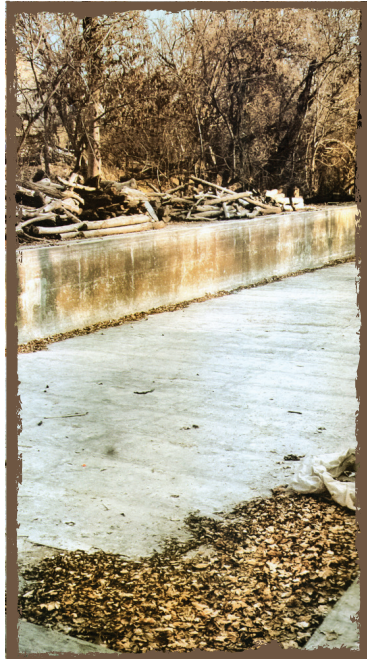
جانبی حوالی استخر هندی