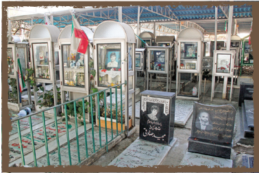
شهیدای محله اوین ۳۵ شهید

ساکنان محله اوین از نخستین روزهای آغاز جنگ تحمیلی تا اوایل دهه ۸۰ هشت‌ساله مردم کشور در مقابل تهاجم دشمن، خاطرات بسیاری را در یاد دارند. تقدیم ۳۵ شهید جنگ تحمیلی برای دفاع از تمامیت ارضی کشور از سوی اهالی مومن و متدین و پایبند به آرمان‌های امام و انقلاب در این محله گواهی بر این مدعاست. به همین بهانه و برای حفظ یاد و خاطره آنها، در این بخش به معرفی برخی از شهیدان محله اوین می‌پردازیم. به نقل از احمد فکری، معتمد محله: