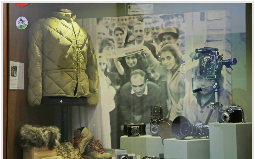
دوربین‌های عکاسی و تجهیزات سفر به دور دنیا