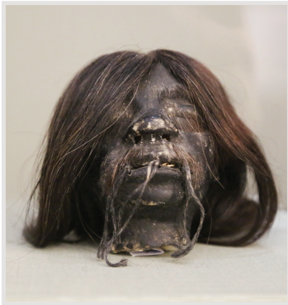
سر کوچک شده واقعی انسان مربوطه به قبیله جبارو که تنها به اندازه یک پرتقال است