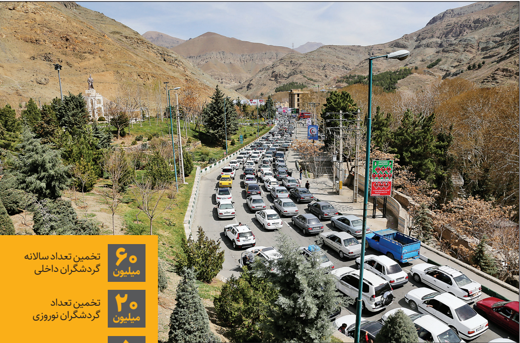
سیلاب فیروزان

جامعه هتلداران ایران: ضریب اشغال هتل‌های کشور در نوروز ۱۴۰۳ به زیر ۵۰ درصد می‌رسد