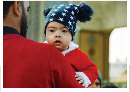
تشریف کودکان سندرم داون به حرم مطهر رضوی تعدادی از مبتلایان سندرم داون به همراه مادران خود روز پنجشنبه، ۱۳ اسفند ۱۴۰۲ به همت بنیاد گرامت رضوی به زیارت حرم رضا امام علیه‌السلام مشرف شدند.