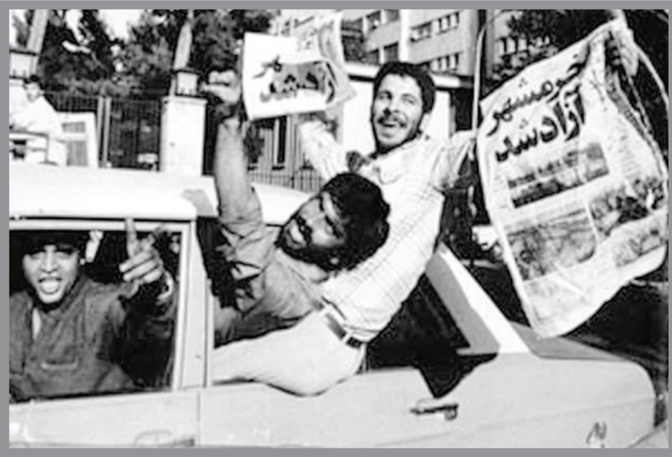
یک روز پس از آزادسازی خوشه‌روزنامه کیهان نخستین گزارش مصور از خوشه‌روزنامه آزاد شده را منتشر کرد که در آن دوره به واسطه فقدان روزنامه‌های متعدد و البته رسانه‌های مجازی، از پربازدیدترین گزارش‌ها محسوب می‌شد.

مطبوعات پایه پای دیگر رسانه‌ها در دوران جنگ تحمیلی در قالب روزنامه‌ها، هفته‌نامه‌ها و مجلات تلاش کردند تصویری حقیقی از رشادت بزرگ مردان ایرانی و نیز حمایت‌های پشت جبهه که توسط زنان، کودکان، فرهنگیان، روحانیان و همه اقشار ملت می‌شد، ترسیم کنند. در ادامه نگاهی کوتاه داریم به گزیده‌ای از این جراید.