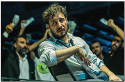
عکاسی از صحنه‌های فیلم «هتل» در جشنواره فیلم فجر

اگر ملاک انتخاب فیلم‌های اکران نوروزی حضور در جشنواره باشد، چه فیلم‌هایی گزینه‌های جذابی برای دفاتر پخش و سینما داران هستند؟ با توجه به مناسبات اکران و اخباری که از رایزنی‌های دفاتر پخش با مدیریت سینما و شورای صنفی نمایش به بیرون درز کرده، ۲ کمدی حاضر در فجر چهل و دوم، بخت بیشتری برای حضور در اکران نوروزی دارند؛ «تمساح خونی» ساخته جواد عزتی و «صیحه‌ها و زرافه‌ها» به کارگردانی سروش صحت. از فیلم‌های غیر کمدی می‌از «مجنون» ساخته مهدی شامحمدی به‌عنوان گزینه اکران نوروزی نام برده شده است؛ فیلم برگزیده جشنواره چهل و دوم که اثری دفاع مقدسی است. ۲ سال پیش هم «موقعیت مهدی» ساخته هادی حجازی‌فر، به‌عنوان فیلم برگزیده جشنواره جهلم به اکران نوروزی آمد و مورد توجه قرار گرفت.