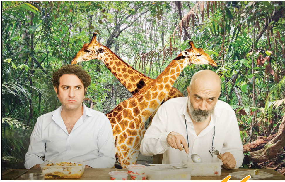
عکاسی از صحنه‌های فیلم «هتل» در جشنواره فیلم فجر