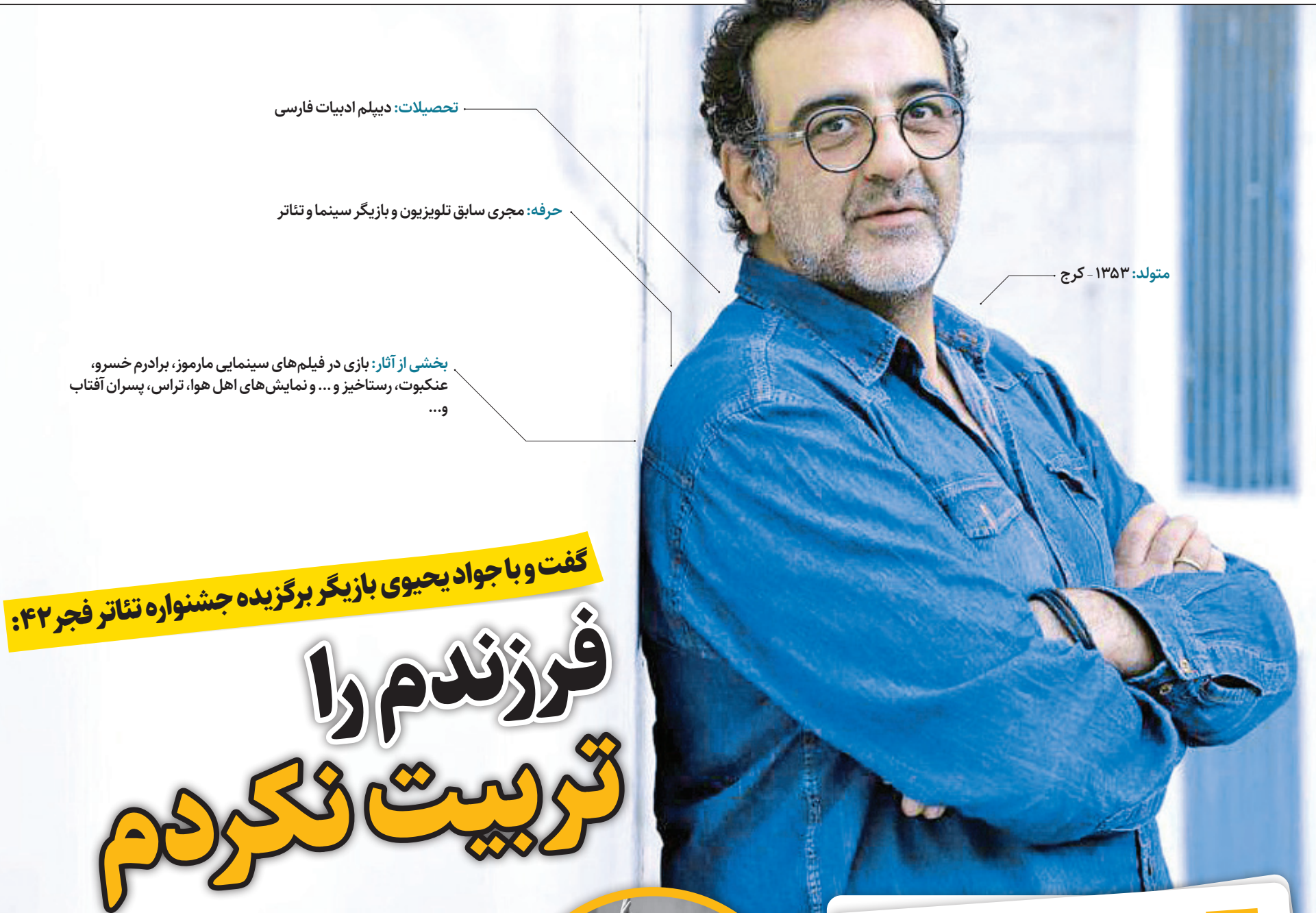
متولد: ۱۳۵۳ - کرج