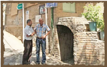
■ آب‌انبار ■ موقعیت: خیابان حصارک

یکی از نمادهایی که از گذشته در حصارک محله جماران به جا مانده، آب‌انباری است در مجاورت مسجد حصارک؛ سازه قدیمی‌ای که خاطره روزهایی را برای اهالی قدیمی جماران زنده می‌کند که آب قنات در آن جاری بود. این آب‌انبار حدود ۲ متر عمق داشت و آب آن از آب قنات جمشیدیه تأمین می‌شد. آب به‌قدری زلال بود که مردم برای آشامیدن و مصارف روزانه از آن استفاده می‌کردند. تا قبل از ساخته‌شدن مسجد، مردمی که برای استفاده از حمام حصارک به سمت بالای جماران می‌آمدند، برای اینکه نمازشان قضا نشود، همان جلو آب‌انبار نماز می‌خواندند. بعدها مسجدی کوچک بالای آب‌انبار ساخته شد که بیشتر شبیه اتاقی بود تا نمازگزاران بتوانند در آن نماز بخوانند. پیشنهاد ساخت مسجد را مرحوم آیت‌الله امام جمارانی داد و با کمک اهالی مسجد که بین مردم به مسجد بالای حصارک معروف است، ساخته شد. مسجد فضایی ساده و حدود ۲۵ متر مربع مساحت دارد و هنوز پابرجاست. خواندن نماز به امامت مرحوم امام جمارانی در این مسجد یکی از خاطرات اهالی حصارک و جماران است.