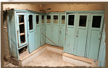
■ حمام ■ موقعیت: خیابان حسنی کیا

جماران هم مانند بسیاری از محله‌های قدیمی حمام عمومی داشت. این حمام در یکی از کوچه‌های فرعی خیابان حسنی کیا بود. آنطور که اهالی محله می‌گویند، حمام جماران معماری زیبایی داشت، گنبدی‌های کاهگلی آن از بیرون دیده می‌شد؛ نمایی که اکنون اثری از آن باقی نمانده و ساختمانی چندطبقه جای آن را گرفته‌است. حمام دو قسمت داشت که اهالی به آنها حمام کوچیکه و حمام بزرگه می‌گفتند. طبق نوبت‌بندی، حمام در طول هفته یک روز برای مردان بود و روز دیگر به زنان اختصاص داشت. آب حمام‌ها از قنات‌های پرآب جماران و جمشیدیه تأمین می‌شد و برای استفاده از آب، حمام را چند پله پایین‌تر از سطح زمین ساخته بودند. جماران حمام دیگری هم داشت که پایین‌تر از تقاطع خیابان‌های تکیه بالا و کوچه قنات و در محله‌ای به‌نام حصارک بود. این حمام، پشت باغ ارشدیر زاهدی بود و معماری خاصی هم نداشت.