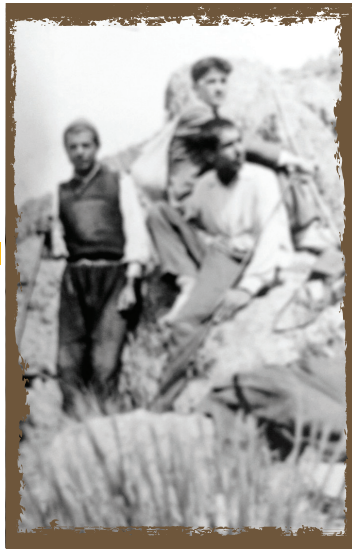
جمعی از اهالی جماران در دهه ۳۰ خورشیدی

جماران هم مانند بسیاری از محله‌های قدیمی حمام عمومی داشت. این حمام در یکی از کوچه‌های فرعی خیابان حسنی کیا بود. آنطور که اهالی محله می‌گویند، حمام جماران معماری زیبایی داشت، گنبدی‌های کاهگلی آن از بیرون دیده می‌شد؛ نمایی که اکنون اثری از آن باقی نمانده و ساختمانی چندطبقه جای آن را گرفته‌است. حمام دو قسمت داشت که اهالی به آنها حمام کوچیکه و حمام بزرگه می‌گفتند. طبق نوبت‌بندی، حمام در طول هفته یک روز برای مردان بود و روز دیگر به زنان اختصاص داشت. آب حمام‌ها از قنات‌های پرآب جماران و جمشیدیه تأمین می‌شد و برای استفاده از آب، حمام را چند پله پایین‌تر از سطح زمین ساخته بودند. جماران حمام دیگری هم داشت که پایین‌تر از تقاطع خیابان‌های تکیه بالا و کوچه قنات و در محله‌ای به‌نام حصارک بود. این حمام، پشت باغ ارشدیر زاهدی بود و معماری خاصی هم نداشت.