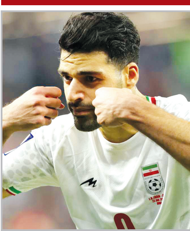
پاسخ به سبک مهدی طارمی