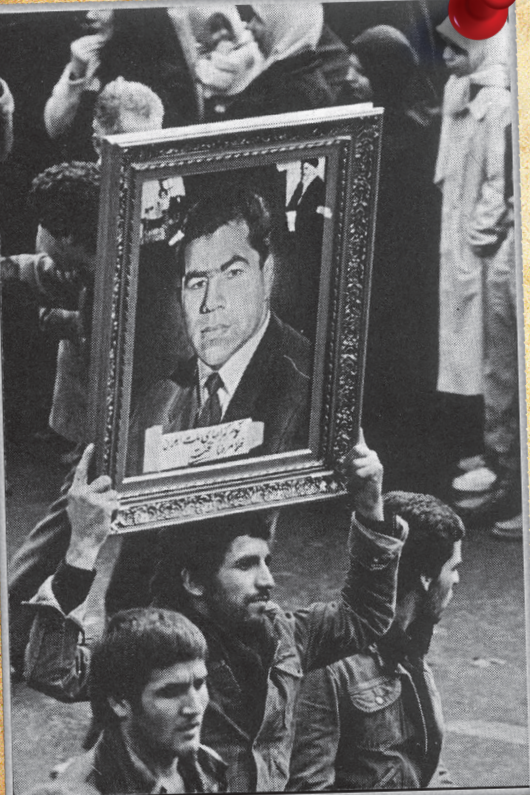
۱۹ آذر، خیابان سعدی

۲۶ آبان، روز بازگشایی دانشگاه تهران