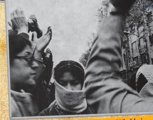
۱۹ بهمن، خیابان انقلاب