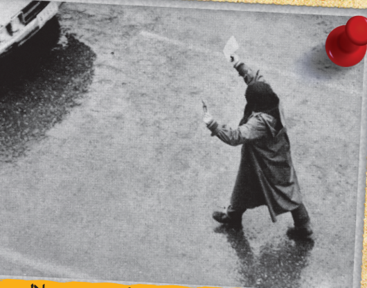
۲۰ آذر، خیابان انقلاب، عکس: بهمن جلالی