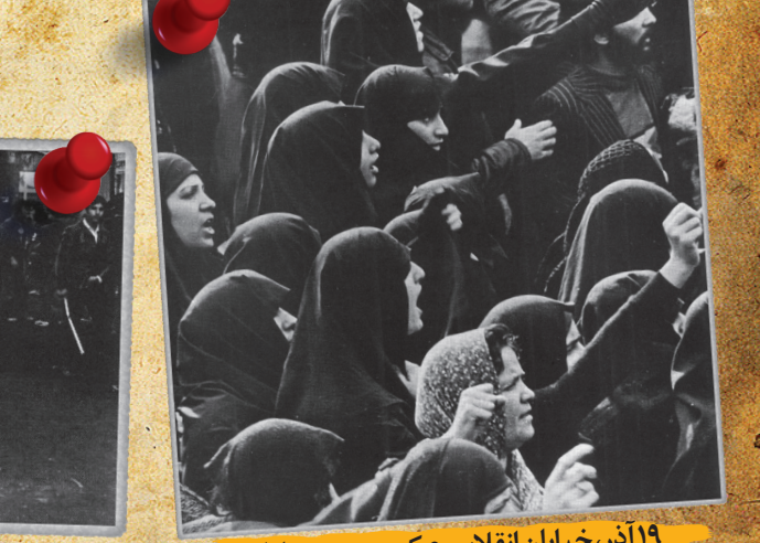
۱۹ آذر، خیابان انقلاب