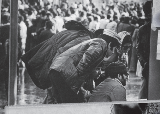
۱۹ بهمن، خیابان انقلاب