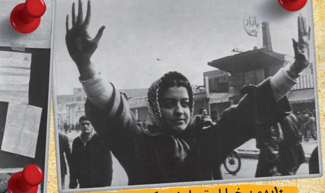
۱۰ بهمن، خیابان تهران نو