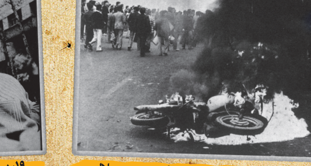
۹ بهمن، خیابان انقلاب، عکس: بهمن جلالی