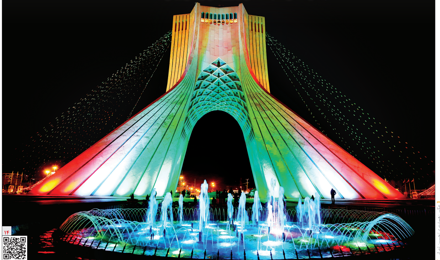
بالسکن این کیوار کد گزاشی درباره جشن انقلاب ببینید.

در چهل و پنجمین سالگرد پیروزی انقلاب اسلامی برنامه‌های متنوع فرهنگی، اجتماعی و ورزشی پیش بینی شده است