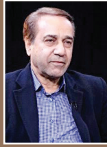
محمد گلریز خواننده