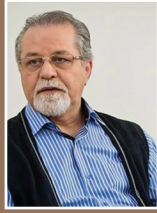
سیدحمید شاهنگیان خواننده و آهنگساز