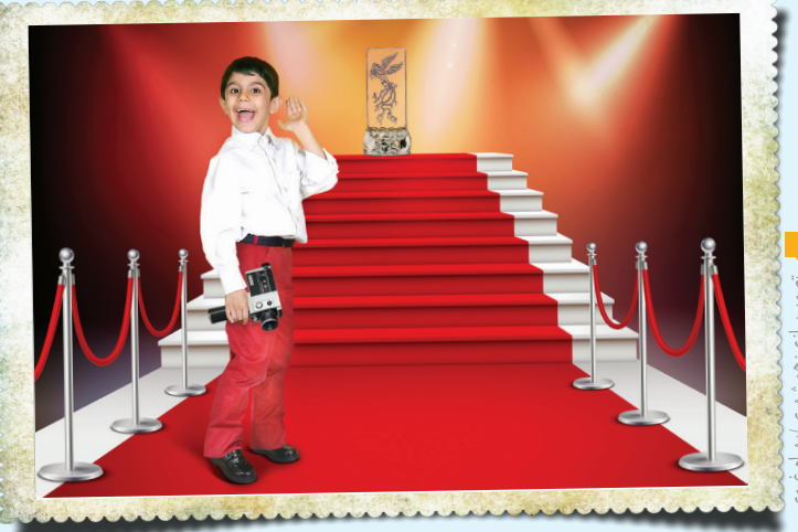
تولید محتوای شبکه‌های اجتماعی با بازیگری

روی‌بخش‌هایی از دیوار دفتر مؤسسه پوسترهایی بزرگ از کودکان بازیگر که در صحنه‌های از فیلم‌های برتر ایران و جهان خوش درخشیده‌اند جلوه می‌کند: «ترکس و نسرین» خواهران غریب، «سعید» میم مثل مادر، «علی» بچه‌های آسمان، «مجید» قصه‌های مجید، «علی» خورشید، «مکالی‌کالکین» تنها در خانه، «تاتالی پورتمن» لئون حرف‌های، «هالی جونل آژمنت» حس ششم،