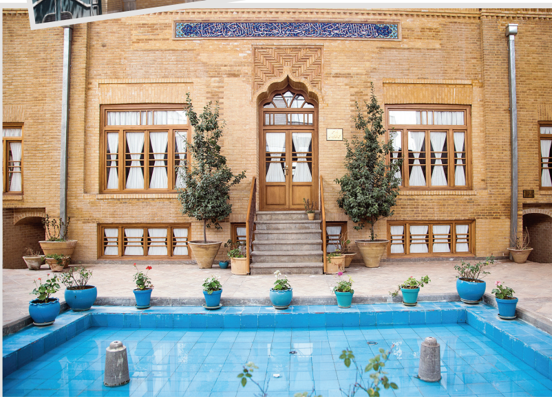
خانه وزیر مختار فرانسه یا همان خانه مدرس