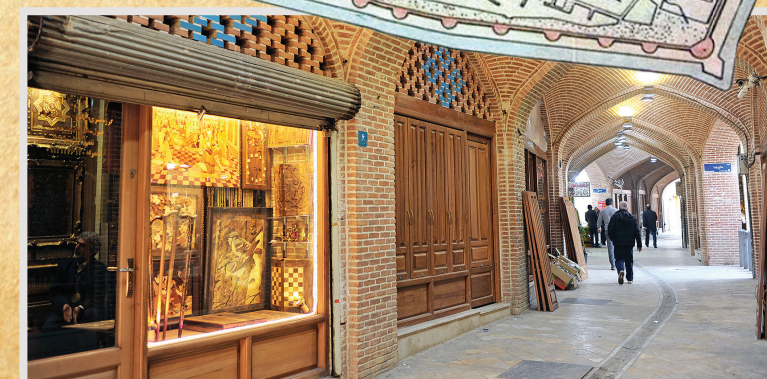
عکس: امیررستمی - بازارچه صنایع دستی عودلاجان