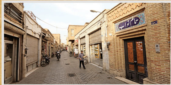
حمام نواب گذر امامزاده یحیی