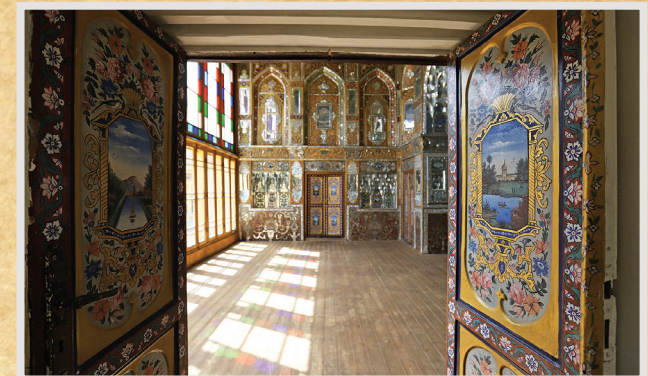
تالار آینه عمارت سلطان بیگم

محله عودلاجان یکی از محله‌های تاریخی و بسیار ارزشمند مرکز شهر تهران است که توانسته ساختار تاریخی خود را تا حدود زیادی حفظ کند و در ۲۴ اسفندماه ۱۳۸۴ در فهرست آثار ملی ایران به ثبت رسیده است. اگر با دقت به نقشه موسیو کرشیش به سال ۱۲۳۷ شمسی نگاه کنیم، ۴ محله اصلی سنگلج، بازار، چاله میدان و عودلاجان و همچنین محدوده ارگ سلطنتی را می‌بینیم. این نقشه نخستین نقشه دقیق از شهر تهران همراه با جزئیات فراوان است که در آن حدود محله‌ها، گذرها، کوچه‌ها، فضاهای مهم شهری و همچنین خانه شخصیت‌های مختلف دوره قاجار مشخص شده است.