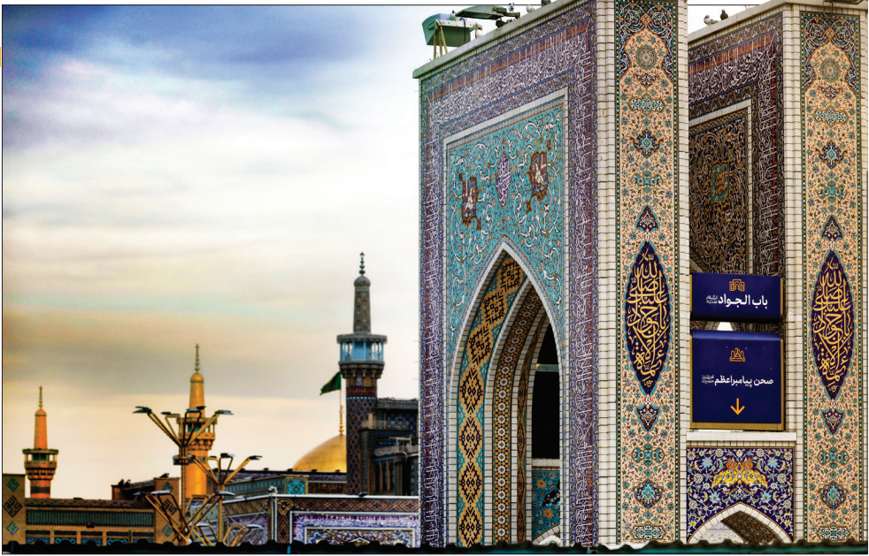
ورودی باب‌الجواد حرم مطهر در شب میلاد پسر امام‌رضاع(ع)

شیخ‌حسین انصاریان، مفسر قرآن کریم: امام جواد(ع) چون اجداد طاهرش، گنجینه‌دار راه‌زای آفرینش بود. امام جواد(ع) با سنی کم با شرکت در مناظره‌ها و مباحثه‌های عالمان و دانشمندان بزرگ خورشیش، علم لدنی که همانا مختص به انبیاء و معصومین است را فرآوری مردمان عصر خود اعصار دیگر به‌تصویر کشید.