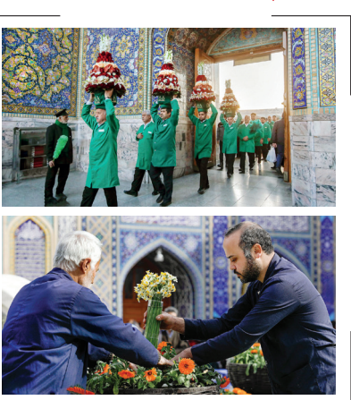
آذین‌بندی حرم امام رضاؑ به مناسبت میلاد حضرت جواد(الکمه)(ع) حرم امامرضا علیه‌السلام توسط خادمان آستان قدس رضوی گل‌آرایی و آذین‌بندی شد.