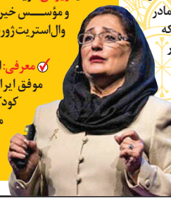
تولد: ۱۳۳۰ تحصیلات: کارشناسی ارشد رشته جامعه‌شناسی