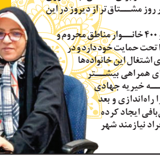
تولد: ۱۳۵۷ تحصیلات: کارشناسی

مادر است و در کنار رساندن در خانه، غمخوار بسیاری از کودکان نیازمند شده و برای نشاندن لبخند روی چهره آنها بی‌وقفه هر روز مشغول‌تر از دیروز در این مسیر گام برمی‌دارد. حالا بیش از هزار و ۴۰۰ خانوار مناطق محروم و حاشیه شهر اردبیل را تحت حمایت خود دارد و در تلاش است، زمینه‌های اشتغال این خانواده‌ها را نیز فراهم کند. برای همراهی بیشتر با نیازمندان، مؤسسه خیریه جهادی «سردار سلیمانی» را راه‌اندازی و بعد از آن نیز کارگاه قالی‌بافی ایجاد کرده است تا کمک حال افراد نیازمند شهر و دیارش باشد.