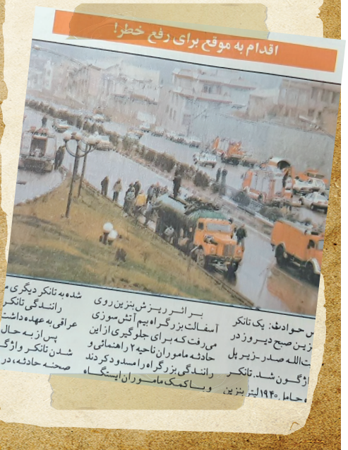
اقدام به موقع برای رفع خطرا بن حوادث: یک تانکر بنزین در بزرگراه صدر واژگون شد. عکاس همشهری در صحنه حادثه حاضر شد. تانکر واژگون شده به تانکر دیگری منتقل شد. عکاس همشهری در صحنه حادثه حاضر شد.