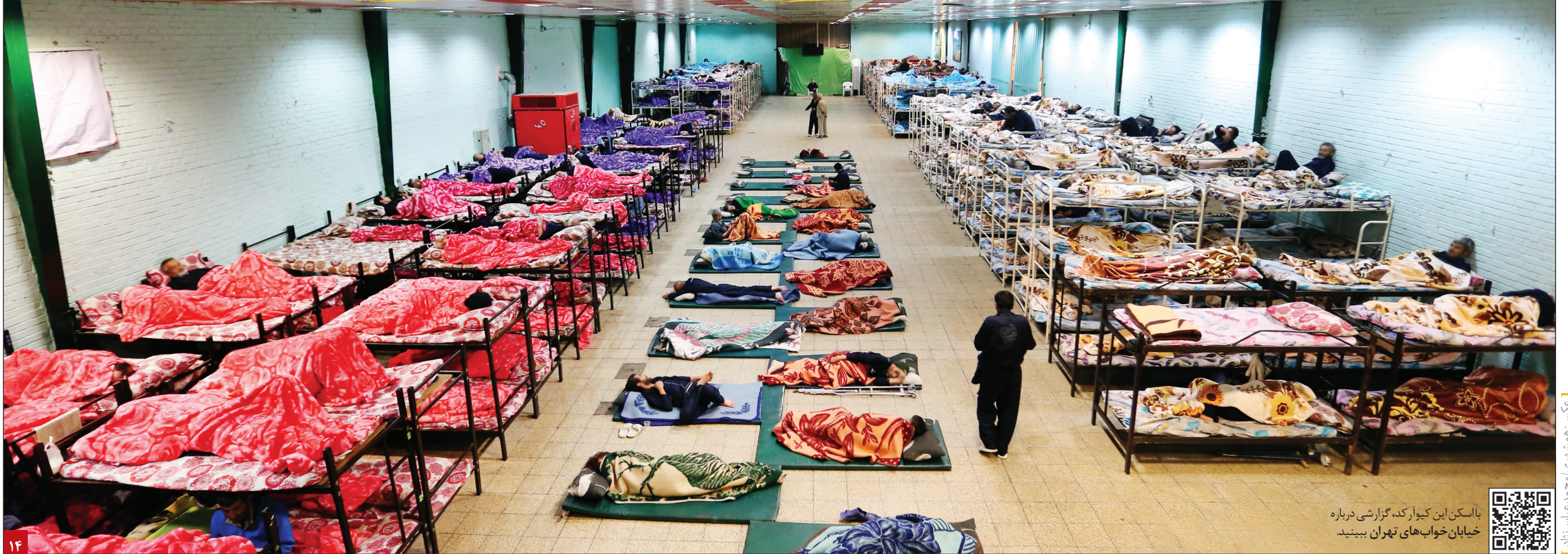
با اسکن این کیو آر کد گزارشی درباره خیابان خواب‌های تهران ببینید

گزارشی درباره خدماتی که در شب‌های سرد تهران به خیابان خواب‌ها ارائه می‌شود