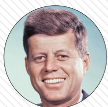
جان اف کندی (۱۹۶۳-۱۹۶۱)