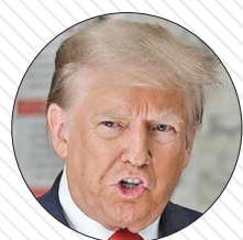
دونالد ترامپ (۲۰۱۷-۲۰۲۱)

ارتباط بیل کلینتون، رئیس جمهور سابق آمریکا با فردی به نام جفری ایستین که به قاچاق کودکان متهم بود، موضوعی است که جنجال زیادی به پا کرده است. گفته می‌شود بیل کلینتون و ایستین، رابطه صمیمانه‌ای داشته‌اند و طبق اظهارات برخی منابع و شواهد، بارها در مجالس و رویدادهای اجتماعی مشترک حضور یافته‌اند. با این حال آنچه ادعای خانواده کلینتون درباره بی‌اطلاعی از فعالیت‌های غیرقانونی ایستین را زیر سؤال برده این است که بیل کلینتون به‌طور مکرر با هوایمی خصوصی ایستین سفر کرده است. بیل کلینتون و همسرش هیلاری کلینتون ادعا می‌کنند که از فعالیت‌های غیرقانونی ایستین اطلاعی نداشته‌اند و سفر بیل کلینتون با هوایمی خصوصی این میلیاردر برای انجام امور خیریه و خدمات اجتماعی بوده است.