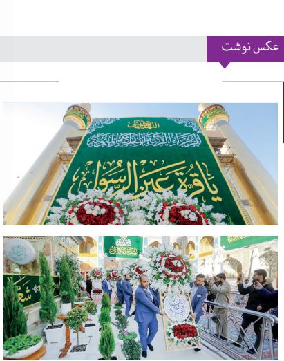
گل‌آرایی ایوان نجف به مناسبت میلاد حضرت زهرا(س) حرم امام‌علی علیه السلام در آستانه سالروز ولادت حضرت زهرا(س) با ۱۵۰۰ شاخه گل طبیعی و کتیبه ها و پارچه‌های سبزرنگ تزئین شد.