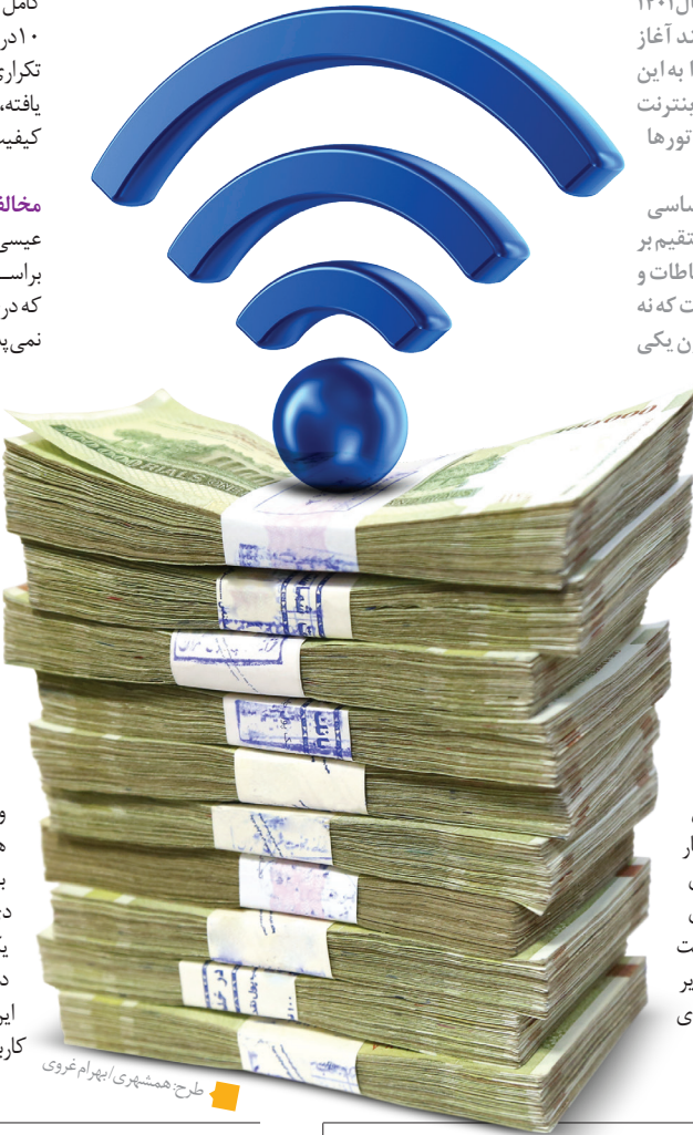
طرح هشتپه‌ری اپهرام غوری

این در حالی است که اپراتورها راه‌حل‌هایی هم برای فشار نیاوردن به مردم ارائه کرده‌اند. به اعتقاد آنها، نیمی از مردم شامل اقشار کم‌برخوردار، ماهانه مصرفی کمتر از ۲ گیگابایت در ماه برای خدمات دیتای همراه دارند و اگر با افزایش تعرفه مواجهت شود، برای حمایت از اقشار کم‌برخوردار ارائه بسته‌های رایگان و ارزان قیمت برای این قشر از کاربران یا هماهنگی و مدیریت دولت امکان پذیر خواهد بود. به گفته اپراتورهای امضاکننده درخواست افزایش بهای اینترنت، عمده درآمد اپراتور از مشترکان بر مصرف است.