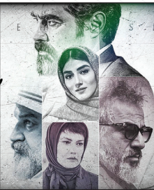
شیر» و «زخم کاری» عنوان می‌کنند.