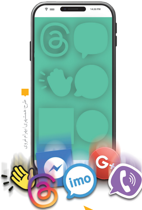
فکر می‌کنم بسیاری پیام‌رسان‌ها

پیام‌رسان فیسبوک که زمانی در دستگاه‌های بسیاری از کاربران به‌طور پیش‌فرض نصب و مورد استقبال بود، حالا دیگر محبوبیت سابق را ندارد. مارک زاکربرگ، مالک فیسبوک که کاهش کاربران فعال روزانه و ماهانه را درک کرده بود، حدود ۲سال پیش تلاش کرد با تغییر استراتژی این شرکت را دوباره به صدر بیاورد، اما چنین چیزی هرگز رخ نداد. او ابتدا نشان تجاری و نام فیسبوک را تغییر داد. متناهی بود که به متاورس پیوند خورد و علامت بی‌نهایت نشان از ادامه‌دار بودن راه جدید شرکت خبر می‌داد. درباره قضیه به اینجا ختم نمی‌شد. اینستاگرام یکی