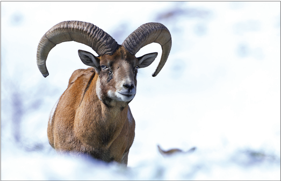
عکس همشهری استان‌اعمال

یک میلیون و ۲۱۸هزار حیوان طی یک دهه در معرض شکار، زنده‌گیری، قاچاق و تاکسیدرمی قرار گرفته‌اند