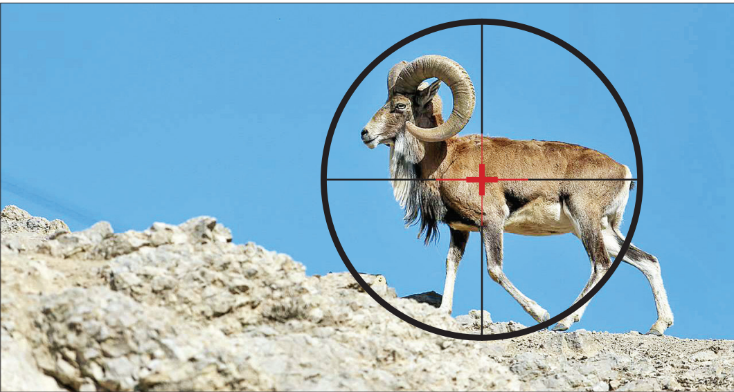
گزارش: زهرا رفیعی روزنامه‌نگار

پیشنهاد افزایش ۷ برابری جرایم شکار روی میز شورای عالی محیط‌زیست قرار دارد