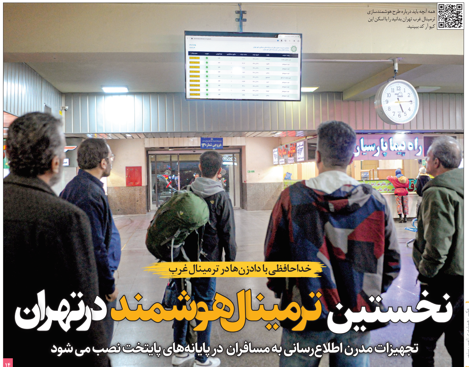
خداحافظی با دادن هادر ترمینال غرب