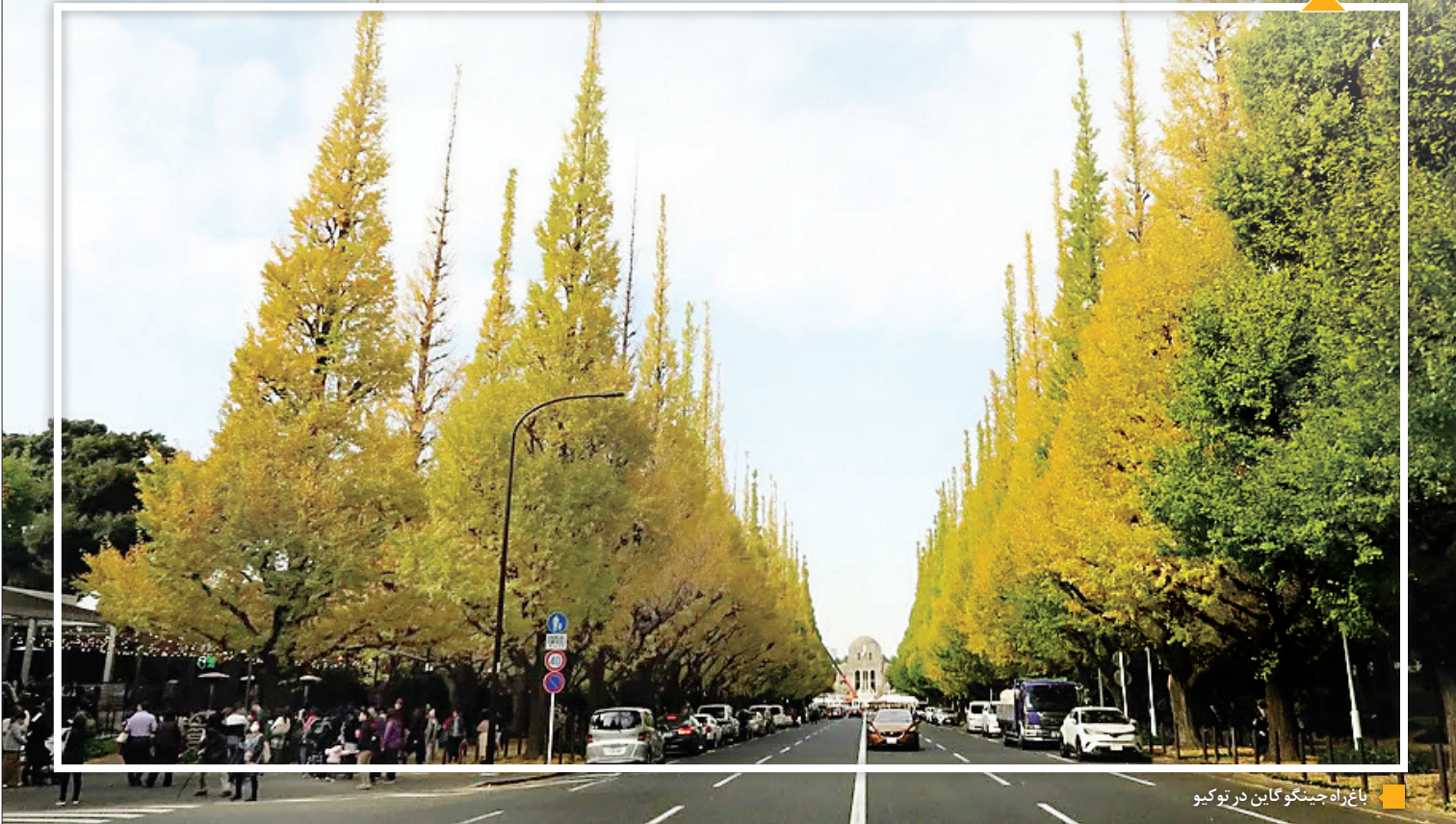
باغ‌راه جینگو گاین در توکیو

چنارها به این دلیل در سیدنی کاشته شده بودند که می‌توانستند در شرایط شهری به خوبی رشد کنند. این درخت‌ها در محوطه‌هایی که کمپوش‌های بتنی داشتند هم باقی می‌مانند و برای مدت‌ها بخشی از فضای سبز شهری بودند، اما گرمایش جهانی و مشکلات محیط‌زیستی ادامه حیات آنها را به خطر انداخته است. در پروژه‌های جدید خیابان‌سازی درختان چنار قطع شده‌اند، اما این کار آنقدر تدریجی انجام شده که حساسیتی برای شهروندان ایجاد نکرده است.