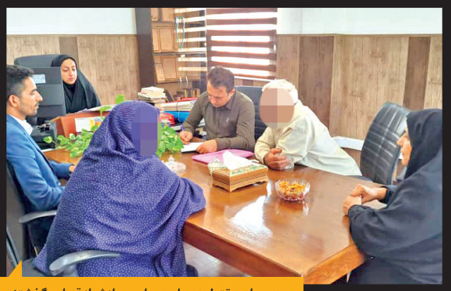
پدر و مادر مقتول در جلسه صلح و سازش از قصاص گذشتند.

به گزارش همشهری، یکی از روزهای پاییز سال ۹۹به‌بار پس جنایی بندرعباس خبر رسید که پسر جوانی در یکی از خیابان‌های شهر در یک درگیری خیابانی به قتل رسیده است. مقتول پسر جوانی بود که بررسی‌های اولیه نشان می‌داد قربانی سرقت شده است. آنطور که شواهد نشان می‌داد عامل جنایت قصد سرقت گوشی موبایل او را داشته اما وی مقاومت کرده و قاتل با جسمی به نام تیغه‌ماهی ضرباتی به او زده و گوشی را سرقت کرد. یه تیغه‌ماهی از استخوان ماهی ساخته می‌شود و مثل جاقو تیز برنده است. کارآگاهان جنایی با انجام بررسی‌های میدانی در کوتاه‌ترین زمان ممکن موفق شدند عامل جنایت را شناسایی کنند. متهم ابتدا قتل را انکار می‌کرد و می‌گفت بی‌گناه است اما در ادامه به جنایتی که مرتکب شده بود اعتراف کرد. او درباره آنچه در روز حادثه اتفاق افتاده بود گفت: چون کار و درآمدی نداشتم تصمیم به سرقت گرفتم. روز حادثه از خیابان عبور می‌کردم که مقتول را دیدم که یک گوشی موبایل در دستش بود و با آن صحبت می‌کرد. من هم سوسوسه‌شدم تا گوشی او را سرقت کنم. در حالی که یک تیغه ماهی همراهم بود به او نزدیک شدم و با تهدید به او گفتم که باید گوشی‌اش را به من بدهد اما او زیر بار نرفت و حاضر به این کار نشد. من هم که تصمیم گرفته بودم به هر قیمتی به گوشی برسیم، با تیغه ماهی ۷-ضربه به سرش زدم و گوشی