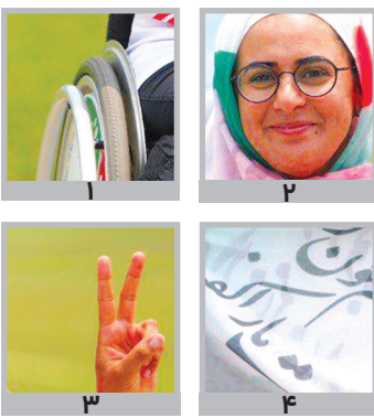
۱۲ آذر روز جهانی معلولان

یک روز جمعه، محمد و روزبه که حسابی گرسنه بودند، به رستوران مجلی رسیدند. آن‌ها چندین پُرس غذا و دسر و نوشیدنی سفارش دادند. اما وقتی پیش‌خدمت - که بعدها فهمیدند همشهری آن‌ها بوده‌است - صورتحساب ناهارشان را آورد، محمد و روزبه فهمیدند که موجودی‌شان برای این غذای گران، خیلی کم است! بعد از چند دقیقه پیچ‌و‌چفت و صحبت درگوشی، مشکل حل شد و تمام پول غذا به صورت اسکناس به رستوران پرداخت شد. بیشترین احتمال این است که پول را چه کسی پرداخته باشد؟! پیش‌خدمت هرگز توان پرداخت این مبلغ را نداشت!