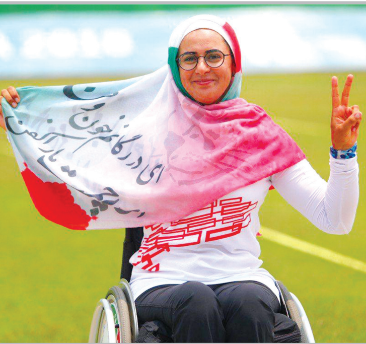
۱۲ آذر روز جهانی معلولان