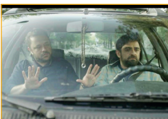
نمایی از سریال سیمت جدید

به‌نظر مشکل مالی اوج با سازمان حل شده است و فصل دوم مستوران سیروس مقدم را تولید می‌کنند. علاوه بر این سریال‌ها، چندین سریال دیگر هم در مرحله تصویربرداری و تدوین و... قرار دارد؛ سریال‌هایی که برخی از آنها به آنتن زمستان می‌رسد و برخی هم آماده پخش در نوروز و ماه رمضان می‌شود. با همه این اوصاف، دغدغه مدیران سازمان همچنان تأمین بودجه ۲۰۰ میلیاردی (سلمان فارسی و حضرت موسی) است.