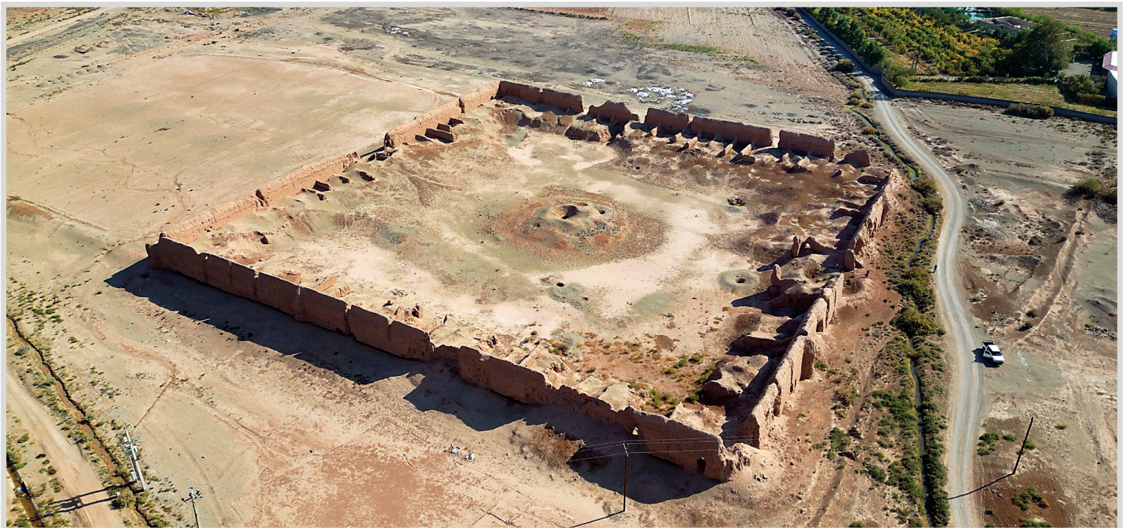
قلعه یا رباط ماری - جاده چشمه نادى

در سمت راست تپه گیس راهی وجود دارد که نهری کوچک از کنار آن می‌گذرد و به قلعه‌ای افسانه‌ای می‌رسد که شاید همان شهر گمشده و باستانی ایوانکی باشد. نامش ماری است. در هیچ کجای کتب و آثار تاریخی از علت نامگذاری این بنا به این اسم اطلاعاتی در دست نیست. رباط یا قلعه ماری اینقدر بزرگ است که به نظر می‌رسد شهری عظیم بوده که می‌توان گفت تپه گیس دژ دیده‌بانی آن و در مسیر اصلی جاده ابریشم قرار داشته است و بنایی مهم و ارزشمند به شمار می‌رود. وسعت و بزرگی بنا، ارتفاع بلند دیوارها و تعداد زیاد حجره‌های آن حکایت از رونق و آبادانی و توجه حکومت‌ها به قلعه ماری در گذشته بوده است.