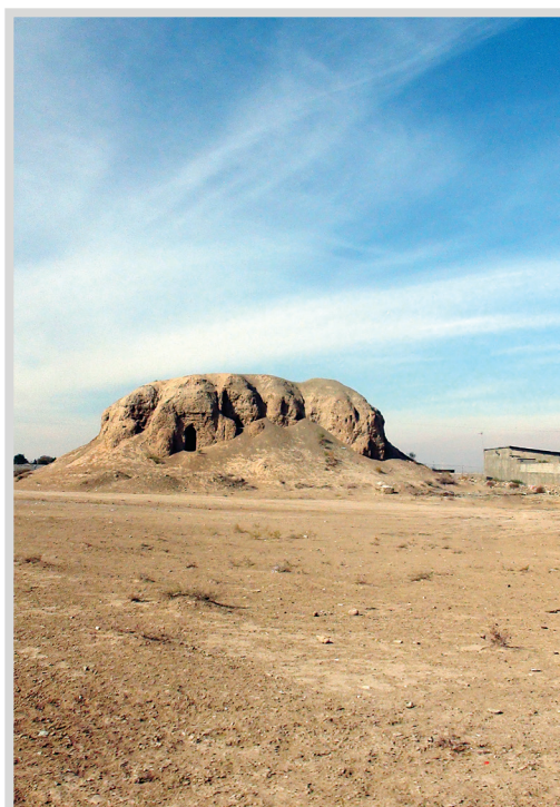
تپه پیرزن - ۵۰۰ متری رباط ماری