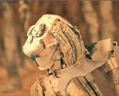
انیمیشن‌های «آینتا، گمشده در اخبار»

انیمیشن‌های «آینتا، گمشده در اخبار» و «آسمان دوست‌داشتنی» در جشنواره انیمیشن هند به نمایش گذاشته می‌شوند. به گزارش ایسنا، مستند انیمیشن «آینتا، گمشده در اخبار» به نویسندگی، کارگردانی و تهیه‌کنندگی بهزاد نعلبندی و «آسمان دوست‌داشتنی» به کارگردانی امیر مهران به جشنواره انیمیشن هند راه یافته‌اند که از ۱۸ آذر برگزار می‌شود.