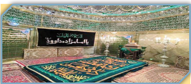
فرش‌های نذر امامزاده داوود در تهران

از روزگار قدیم در قریه کن رسم بر این بوده که مردم در روزهای آخر هفته محصولاتشان را به امامزاده داوود می‌بردند و به‌عنوان نذر بین زائران تقسیم می‌کردند. همچنین اهالی کن، به‌خصوص قالیباف‌های روستای کیگا، نیت می‌کردند که نخستین قالی را بعد از برچیدن گره‌های دار قالی نذر امامزاده داوود کنند و به همین دلیل فرش‌های امامزاده در آن روزگار چمکنی نو و پرزرق و برق بوده است. نذر فرش در کن به‌خصوص در روستای «کیگا» تا چند دهه قبل هم رواج داشت، اما بعد از گرانی سرسام‌آور نخ و برچیده شدن دارهای قالی کم‌رنگ شد و آرام آرام از پادها رفت. قدیمی‌های کن می‌گویند هنوز هم برخی از فرش‌های نذری در صحن امامزاده هست. این