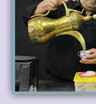
مراسم نذر در تهران