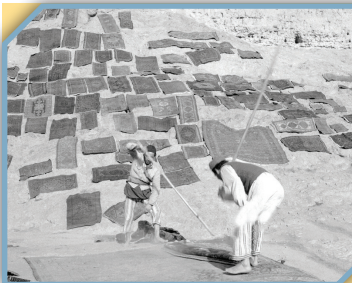
فرش‌های نذر امامزاده داوود در تهران