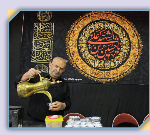
مراسم نذر در تهران

انتخاب نذری‌هایی که در اماکن مذهبی و تاریخی توزیع می‌شوند هر کدام برای خودسانی شنیدنی و عمری به اندازه تاریخ راه‌اندازی حسینیه و تکیه دارد. یکی از نذری‌های قدیمی و پرطرفدار تکیه تاریخی تجریش در ایام محرم، دم‌کردن قهوه و پذیرایی در استکان‌های مخصوص است. هنوز هم می‌توان در آبدارخانه تکیه بالای تجریش بوی خوش قهوه را استشمام کرد و پیرمردی با موهای سفید را دید که با مهارت تمام قهوه را در قوری مخصوص می‌گذارد و منتظر می‌ماند تا سر صبر دم بکشد. او پس از آنکه قهوه را با چاشنی‌هایی خوش‌عطر و طعم ترکیب می‌کند، در استکان‌های مخصوص قهوه از عزاداران مهمان آبدارخانه تکیه پذیرایی می‌کند. پارچ استیل و قهوه‌جوش و اجاقکی که مخصوص دم کردن قهوه است همه نشان از پابندی اهالی تجریش به اجرای سنتی قدیمی در تکیه‌ای دارد که قدمتش به دوران قاجار می‌رسد. تکیه بالای تجریش یک روز از ایام عزاداری را هم با چای ترش پذیرایی می‌کند.