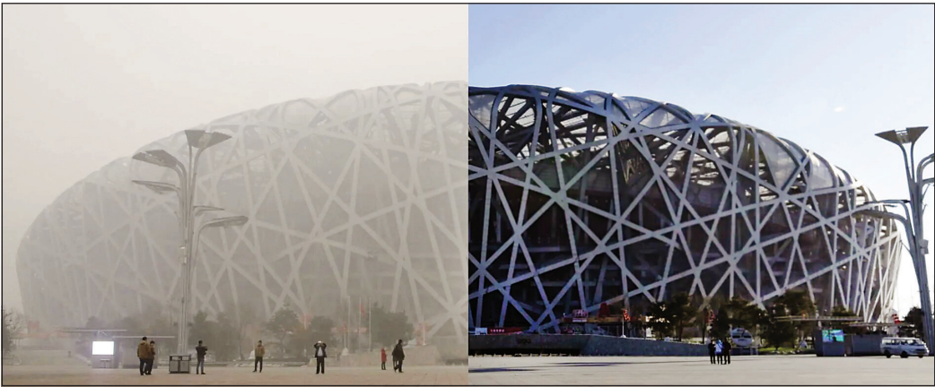
نمای روزنامه‌نگاری پکن در سال‌های قبل، ویدئو برای آلوده‌سازی و تخریب محیط‌زیست

۱۰سال مبارزه پکن و دیگر شهرهای چین با آلودگی هوا نتایج مثبتی داشته است