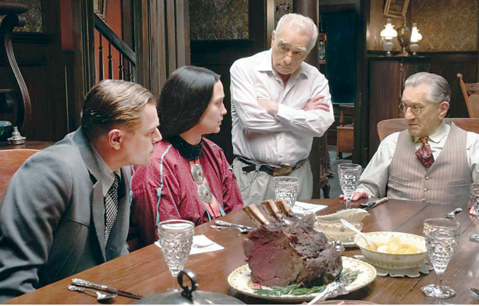
تئاتر صحنه «قاتلان ماه کامل»

در شبکه‌های مجازی چیزی درباره کیفیت زبایی شناختی یا برداشت‌های اخلاقی و ایدئولوژیک فیلم‌ها پیدانمی‌کنید، اما تا دل‌تان نخواهد نظرات شکوۀ آمیزی درباره زمان زیاد فیلم‌هایی مثل «مرد ابرلندی» و «قاتلان ماه