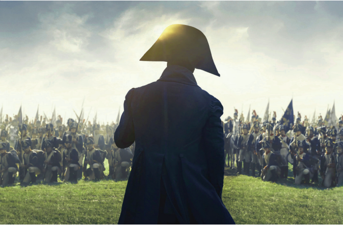
نمایش فیلم ناپلئون