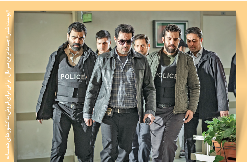
«پوست شیر» جدیدترین سریال ایرانی در فروش به کشورهای همسایه