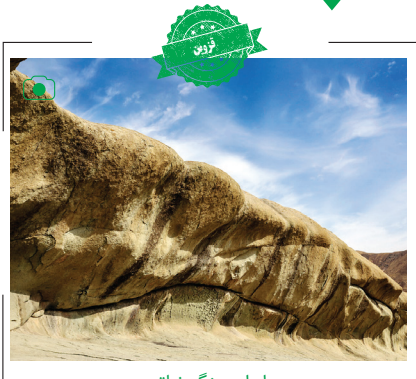
ایوان سنگی نیاق ایوان سنگی نیاق از جاذبه‌های گردشگری قزوین در روستایی به همین نام است که ۱۷ کیلومتری این شهر قرار دارد. این ایوان صخره بلندی است که در اطراف آن به دلیل عوامل زمین‌شناسی ۲ فرورفتگی بزرگ ایجاد شده که شبیه طاق هستند و در روزهای بارندگی پر از آب می‌شوند.