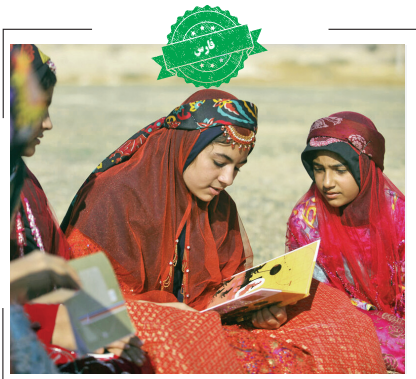
اردوی کتابخوانی عشایر سومین اردوی کتابخوانی عشایر فارس به میزبانی این‌نشینان فیروزآباد، در منطقه عشایری منگرگ شهرستان فیروزآباد برگزار شد. برگزاری برنامه‌های ترویجی و فرهنگی کتاب‌محور، اهدای کتاب، ارائه خدمات کتابخانه‌سپار در مناطق عشایری، جمع‌خوانی و... از برنامه‌های این رویداد است.