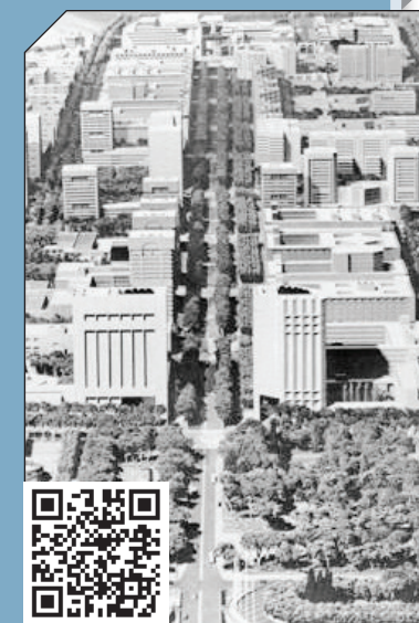
ماکت شهستان پهلوی

نام قبلی: طرح جامع شهستان پهلوی نام فعلی: مجموعه فرهنگی تفریحی عباس آباد منطقه: ۶ نشانی: بین مسیرهای بزرگراه‌های مدرس، همت و رسالت