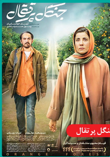
جنگل پر تقال

این فیلم سینمایی نخستین ساخته سینمایی لیلی عاج است و از داستانی واقعی الهام گرفته شده است. فیلم بین قصه‌اش و پایبندی به ماجرای واقعی ملق است و رنگ و بوی شعاری گرفته است.