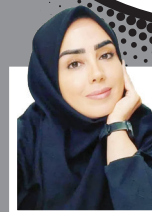
یوکابدمشفق وکیل دادگستری

با پیشرفت علم و تکنولوژی، جرائم نیز شکل متفاوتی به خود گرفته و رایانه نیز در شکل ارتکاب جرائم تأثیرگذار بوده است. جرائم رایانه‌ای می‌تواند شامل فعالیت‌های مجرمانه‌ای باشد که ماهیت سنتی دارند اما از طریق رایانه و اینترنت صورت می‌گیرند. جرائم سایبری یا مجازی شکل توسعه یافته جرائم رایانه‌ای هستند که از طریق شبکه جهانی اینترنت محقق می‌شوند.