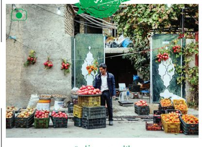
انارچینی در فاروق

فاروق، شهری در شمال شرقی استان فارس و از توابع شهرستان مروذشت است که در فاصله ۷۵کیلومتری شیراز قرار دارد و به شهر انار مشهور است. سالانه ۲۲هزار تن انار از باغات منطقه برداشت می‌شود. در نیمه آبان هم جشنواره انار در این منطقه برگزار می‌شود.