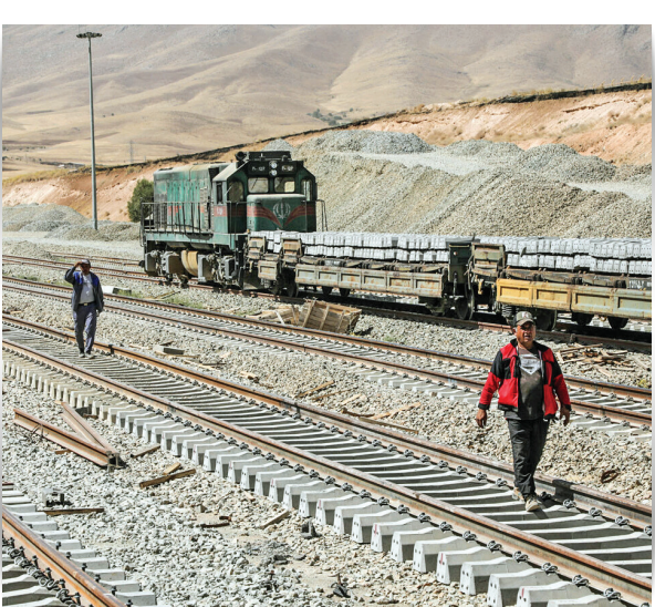
راه‌آهن همدان-سنندج یکی از این پروژه‌هاست.

معاون اقتصادی استاندار کردستان در دومین سفر رئیس‌جمهوری می‌گوید